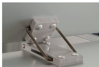
Charnière avec butée de retenue du couvercle