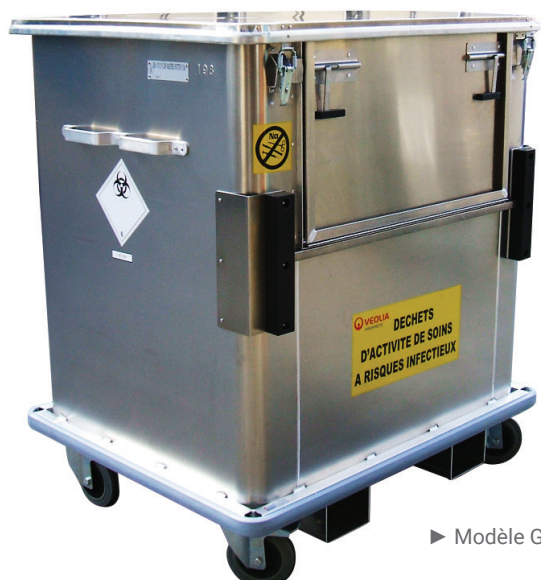
► Modèle GE780