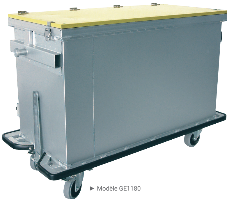
► Modèle GE1180